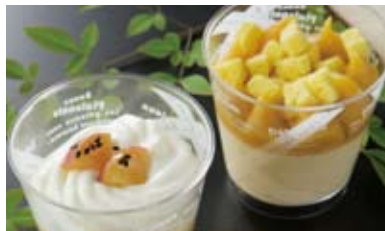
「蜜芋カップスイーツ」