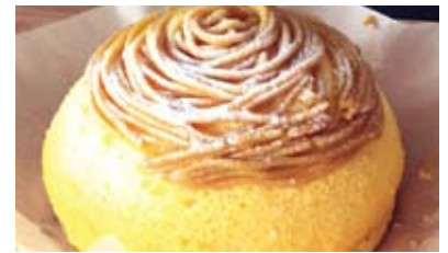
「蜜芋スフレチーズケーキ」